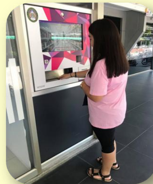
เครื่องคืนหนังสือด้วยตนเอง (Book Return)