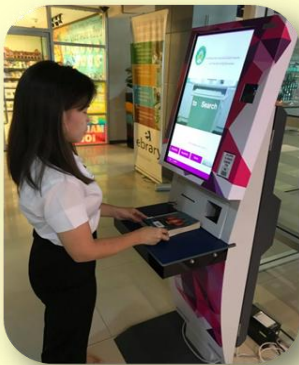
เครื่องยืมหนังสือด้วยตนเอง (Self Check)

จึงขอเชิญชวนนักศึกษา อาจารย์ และบุคลากรมหาวิทยาลัยใช้บริการได้ตั้งแต่บัดนี้เป็นต้นไป